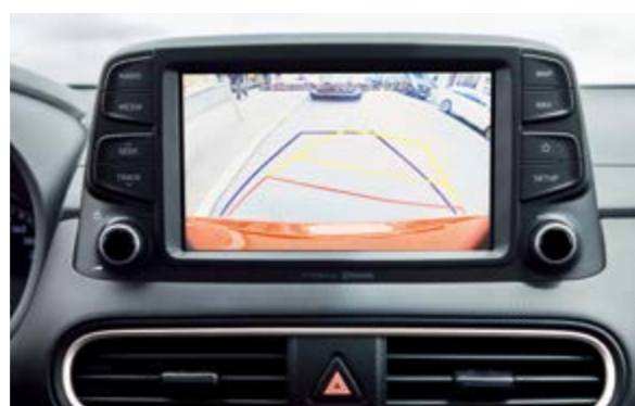
Camera lùi tích hợp