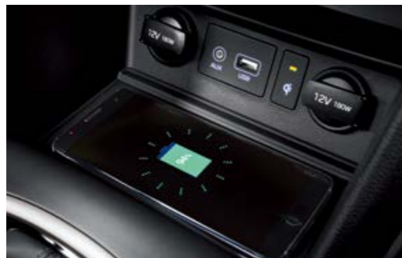
Sạc không dây chuẩn Qi