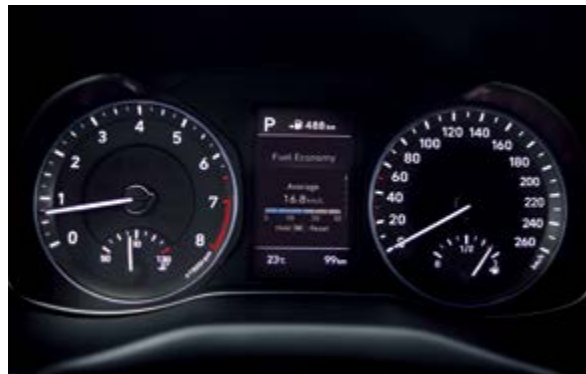
Màn hình thông tin đa chức năng 3,5 inch

Với mức độ hoàn thiện cao, chú ý đến từng chi tiết, Hyundai Kona sở hữu nội thất rộng rãi, tiện nghi và tinh tế. Những điểm nhấn về công nghệ và tính năng giúp bạn có thể cá nhân hóa không gian nội thất trở nên cá tính và độc đáo hơn.