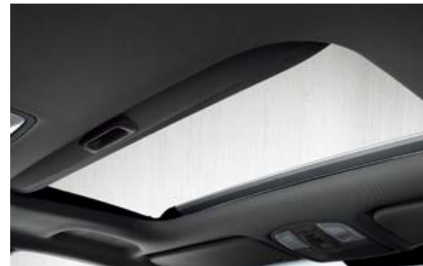
Cửa sổ trời