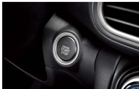
Chìa khóa thông minh kết hợp khởi động nút bấm