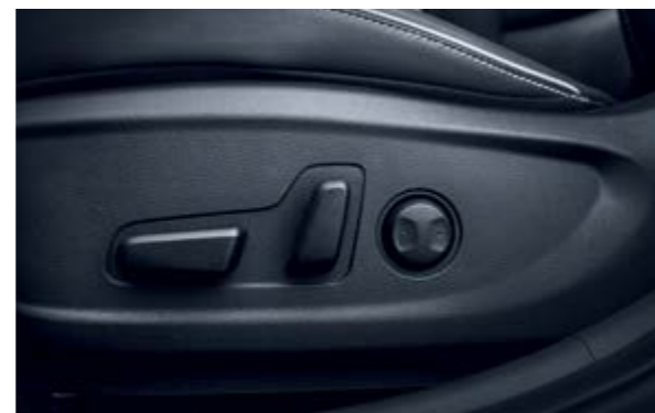
Ghế lái điều chỉnh điện 10 hướng