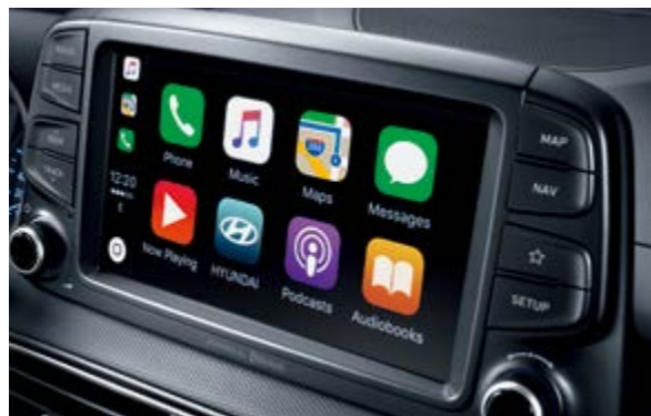
Màn hình cảm ứng 8 inch tích hợp Apple Carplay & Hệ thống định vị dẫn đường