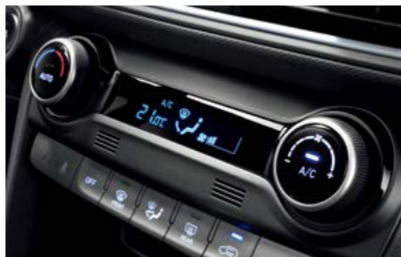
Điều hòa tự động tích hợp khử ion